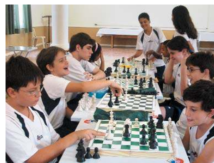
Xadrez: raciocínio lógico e estratégico