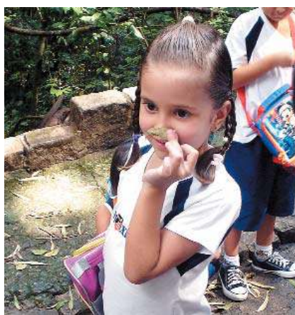
Como é bom sentir a natureza!

Nas salas, aprenderam a cuidar de um aquário, um insetário e dois ramsters. Aprenderam, também, a identificar insetos, a partir de uma lista que eles mesmos elaboraram. Muitas outras descobertas (afeto, responsabilidade e trabalho coletivo) foram possíveis a partir do tema principal, largamente utilizado na alfabetização dos alunos.