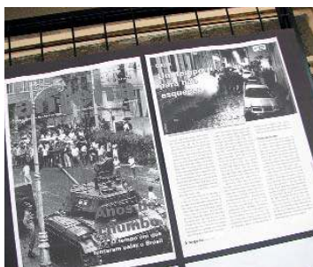
Exposição de painéis com fatos da época