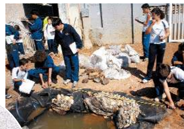
Medições feitas no início do projeto