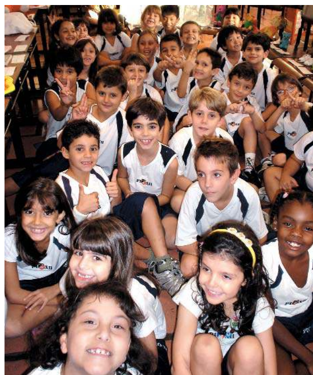
Atenção e envolvimento em todas as atividades