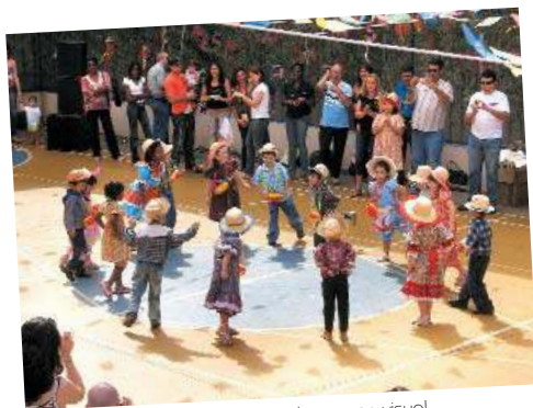
Os baixinhos capricharam no visual