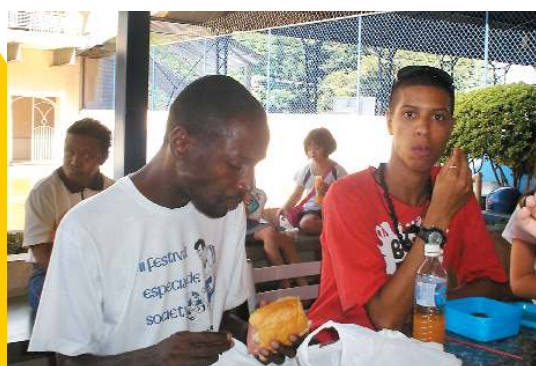
Integração na hora do lanche

Na avaliação dos alunos este foi um estudo especial, porque conheceram uma rotina escolar diferenciada, ficaram sensibilizados e viveram os sentimentos de respeito, amizade, solidariedade e amor.