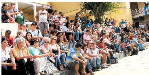
Familiares e amigos prestigiaram a Festa Junina do PIO XII