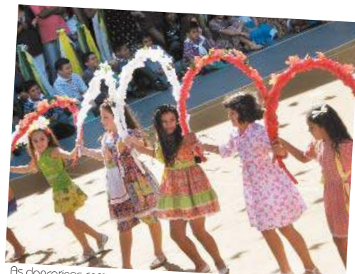
As dançarinas com os arcos chamaram a atenção pela simpatia