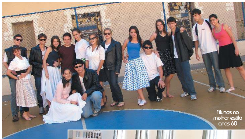
Alunos no melhor estilo anos 60