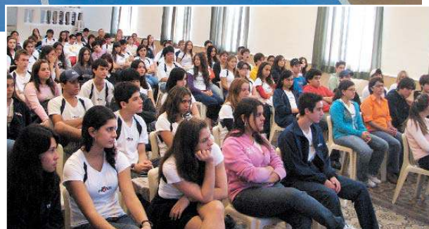
As palestras foram consideradas fundamentais pelos alunos