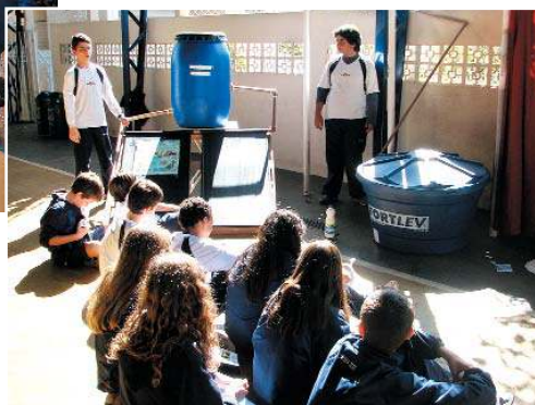
Limpeza da caixa d'água e aquecimento solar