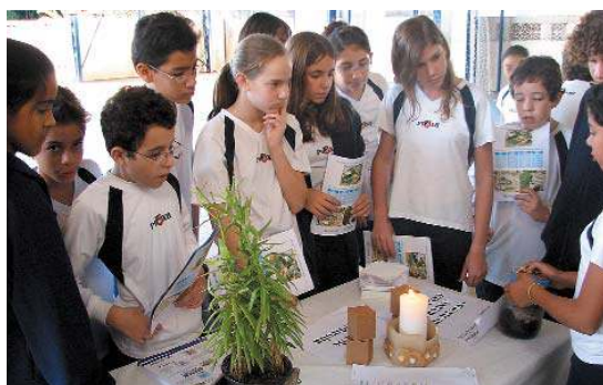
Inseticidas naturais foram apresentados na Semana do Meio Ambiente

A água foi tema de projetos realizados com as turmas do Fundamental II, durante o semestre. O objetivo foi enfatizar a importância e o valor da água, abordar questões sobre sua escassez e preservação.