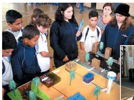
No Colégio, alunos multiplicam informações para os colegas