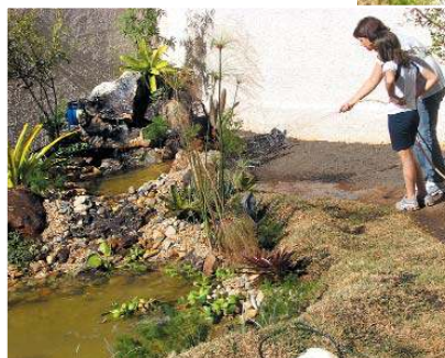
Utilização de água sem desperdício