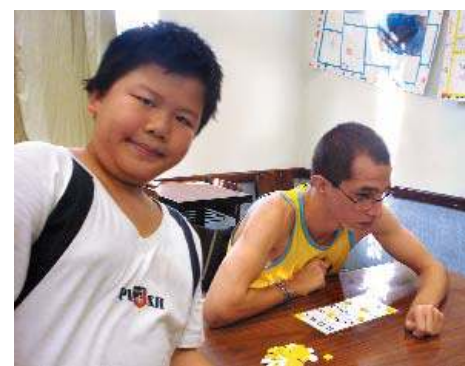
Alunos conheceram o "Espaço Inclusivo"