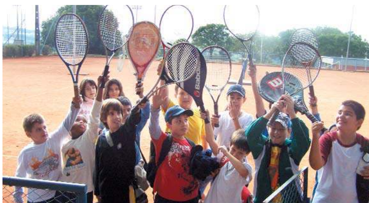
O tênis de campo é bastante concorrido!

No início do segundo semestre, quem não participou terá mais uma oportunidade. É só ficar atento às circulares. As atividades acontecem no Campus I da PUC-Campinas em parceria com a Faculdade de Educação Física.