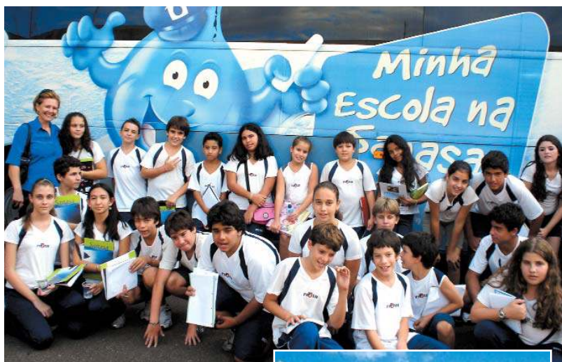
A animada turma do Fundamental II