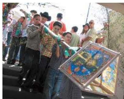
Alunos participaram do levantamento do mastro de Santo Antônio, São João e São Pedro

O Pio XII promoveu um show de novidades na Festa Junina deste ano! Realizado no dia 14 de junho, mais uma vez o evento foi considerado um sucesso de público e de participação, com a presença de pais, alunos, ex-alunos e amigos.