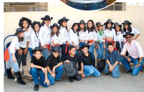
O Fundamental II marcou presença