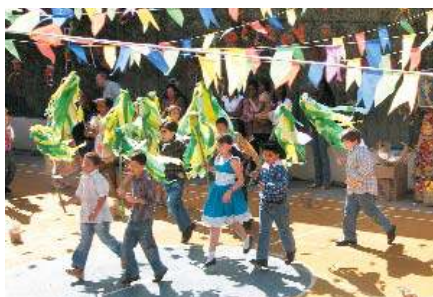
Danças típicas encenadas pelos alunos do PIO XII