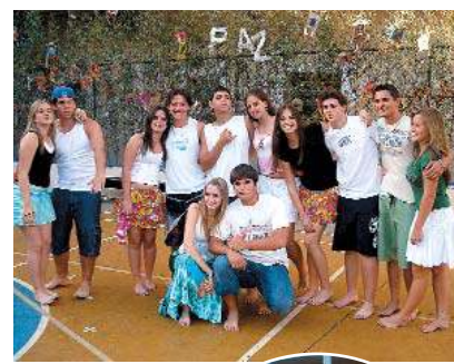
Teve arrasta-pé para balançar os esqueletos!

Além das concorridas barracas de guloseimas típicas, brincadeiras e apresentações de danças (as turmas de 5ª a 8ª fizeram sua própria coreografia!), nossos alunos participaram do levantamento do mastro de Santo Antônio, São João e São Pedro.