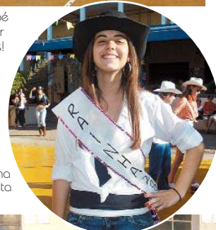
A rainha da Festa