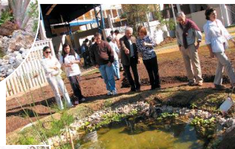
Um projeto de todos!