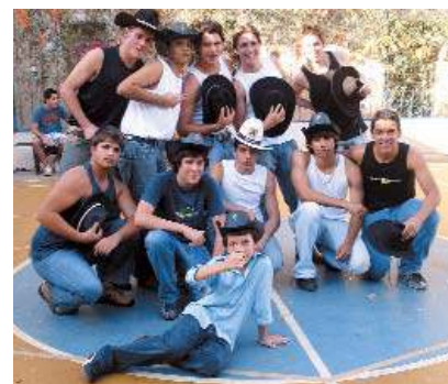
Os meninos mostraram que também têm gingado na dança!