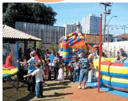
É ainda: muita diversão para a criançada!

Sem dúvida, foi mais um show de compromisso ambiental realizado pela comunidade Pio XII.