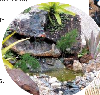
A queda dá movimento à água