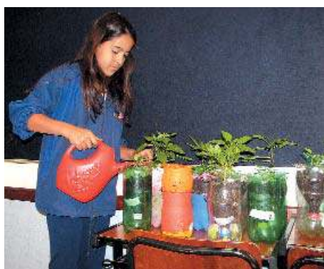
Plantas, cuidadas pelos alunos, antes de serem transferidas