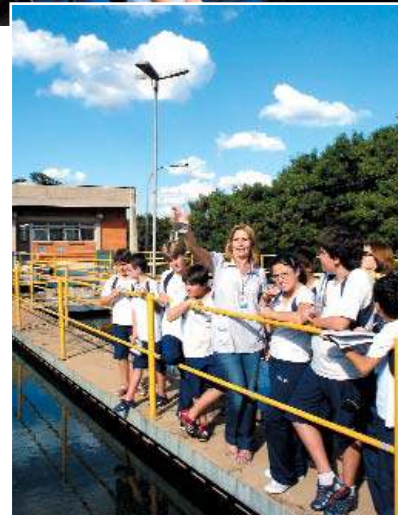
Visita à Sanasa: captação, tratamento e distribuição de água