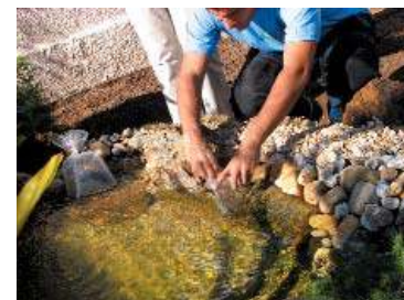
Momento em que o lago ganhou peixes