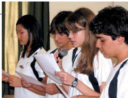
Apresentação de poesia na Festa da Água

Em 22 de março foram realizadas apresentações de dança, música e poesia pelos alunos, no auditório do Colégio. Durante o evento, todos ouviram informações importantes sobre os problemas da água no planeta.