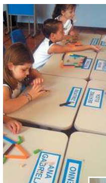
Jogos de classe