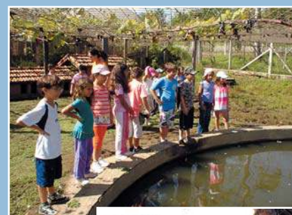
As turmas viveram o contato com a natureza e os animais