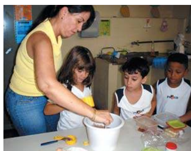
Deliciosos quitutes na aula de culinária