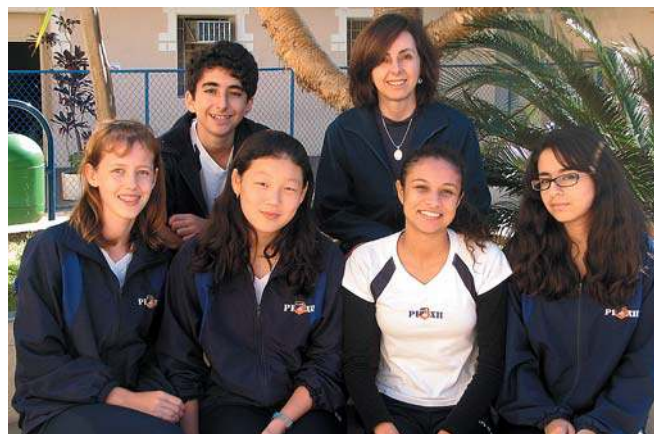
Alunos da 8ª série se preparam para a formatura!

Os alunos ainda estão trabalhando na arrecadação de fundos, vendendo doces todas as terças-feiras; organizaram uma rifa na Páscoa e venderam ingressos na portaria da escola durante a festa junina, em que ainda se responsabilizaram pelas barracas da argola e do correio elegante.