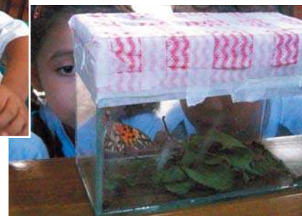
As crianças acompanharam o 1º voo da borboleta!