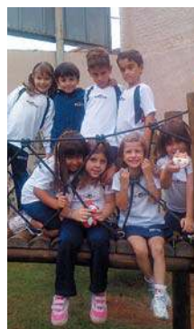
Brincadeiras no parque

O primeiro semestre foi repleto de atividades para o 1º ano do Ensino Fundamental e, em cada uma delas, integração, amizade, imaginação e muito, muito aprendizado. Confira!