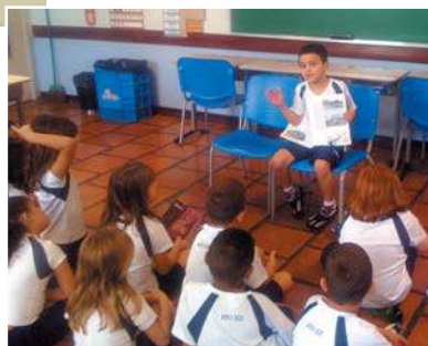
Hora da leitura

Dia Fora-de-série! > Em 26 de maio, as turmas de Educação Infantil e 1º e 2º anos do Ensino Fundamental foram ao Recanto São José, em Mogi Mirim, onde passaram momentos de integração, convivência e recreação. Em contato direto com a natureza, nossos alunos andaram a cavalo e de pedalinho, tiraram leite da vaca, visitaram a horta, tomaram chuva de mangueira, passearam de trem e saborearam deliciosos quitutes.