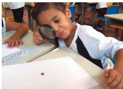
As crianças conheceram o universo dos insetos e se divertiram a valer!

A turma do Infantil III, incomodada com algumas abelhas que rondavam os alunos na hora do lanche, despertou o interesse pela vida desses insetos. Os alunos observaram as abelhas no laboratório, aprenderam sobre suas funções e importância para o meio ambiente, a vida harmoniosa em sociedade. O projeto foi finalizado com a apresentação do teatro "Abelhas Amigas".