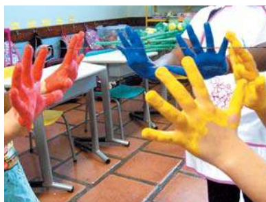
Aprendendo com alegria!

Os pequenos conheceram o resultado da mistura das cores de uma maneira bem diferente! A sala foi dividida, cada grupo pintou as mãos com uma cor e um grupo de três cores foi formado. Com uma dança de mãos dadas, as três cores se transformaram em seis!