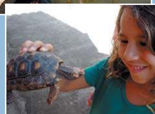
Uma experiência incrível!